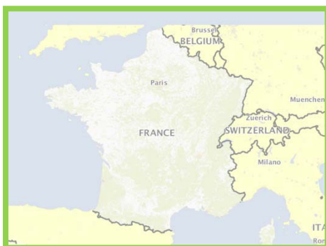
Lille au 1 : 7 000 000