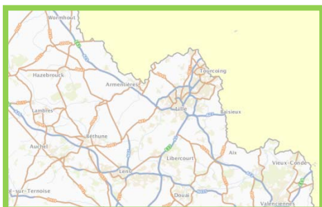
Lille au 1 : 430 000