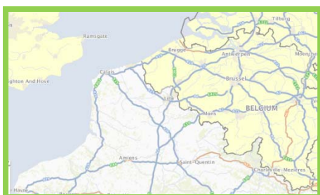
Lille au 1 : 1 730 000