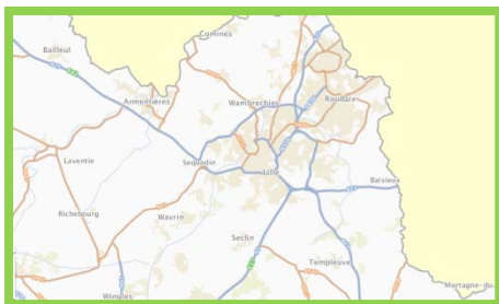
Lille au 1 : 216 000