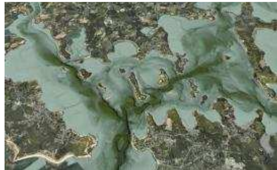
Litto3D® - Golfe du Morbihan