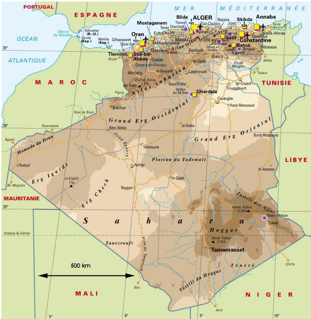
Annexe 1 : carte de l'Algérie