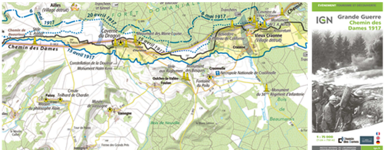
Extrait de la carte Grande Guerre - Le Chemin des Dames 1917 © IGN

Réalisée en partenariat avec la Mission du centenaire et le Conseil départemental de l'Aisne, la carte IGN Grande Guerre - Chemin des Dames 1917 présente un fond cartographique moderne à l'échelle du 1 : 75 000 (1 cm = 750 m) sur lequel s'inscrivent les lignes de front, les vestiges militaires, les itinéraires touristiques, les lieux de mémoire, les musées, etc. Un zoom au 1 : 35 000 (1 cm = 350 m) détaille la zone principale de la bataille. Théâtre de combats meurtriers d'avril à novembre 1917, Le Chemin des Dames s'étend des vallées de l'Aisne au sud, jusqu'à la vallée de l'Ailette au Nord.